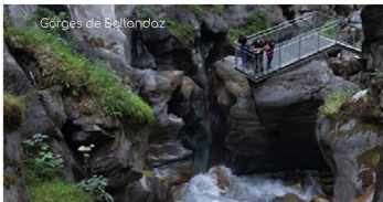
Gorges de Ballandaz