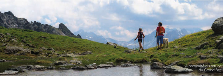
A proximité du refuge du Grand Bec