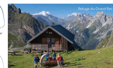
Refuge du Grand Bec