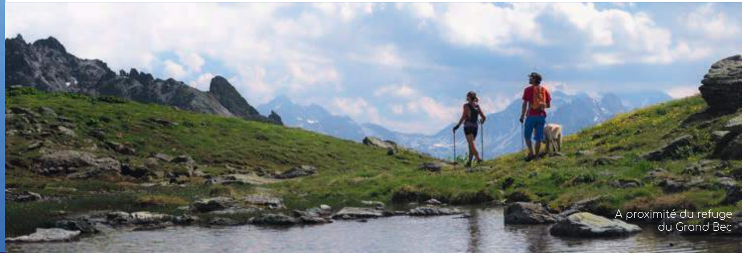
A proximité du refuge du Grand Bec