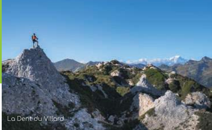
La Dent du Villard