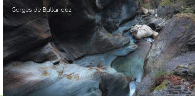
Gorges de Ballandaz