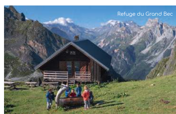
Refuge du Grand Bec